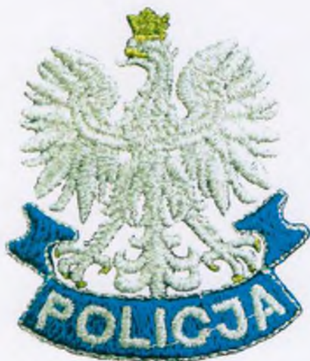
Wzór wizerunku orła na nakryciach głowy