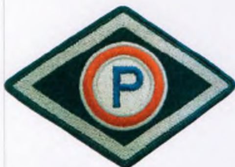
Służba prewencyjna (z wyłączeniem komórek organizacyjnych ruchu drogowego)