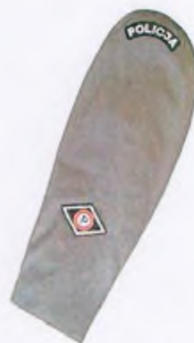
Sposób umieszczenia napisu „POLICJA” na rękawie kurtki gabardynowej galowej