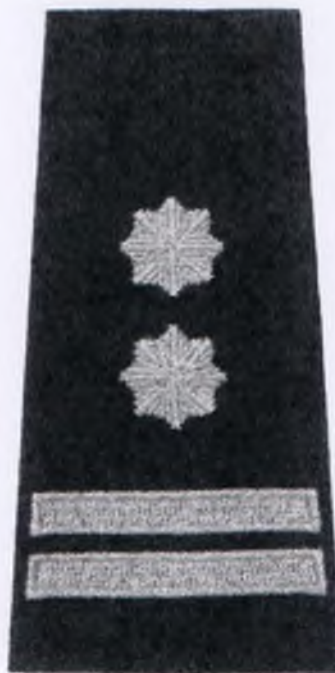
młodszy inspektor Policji