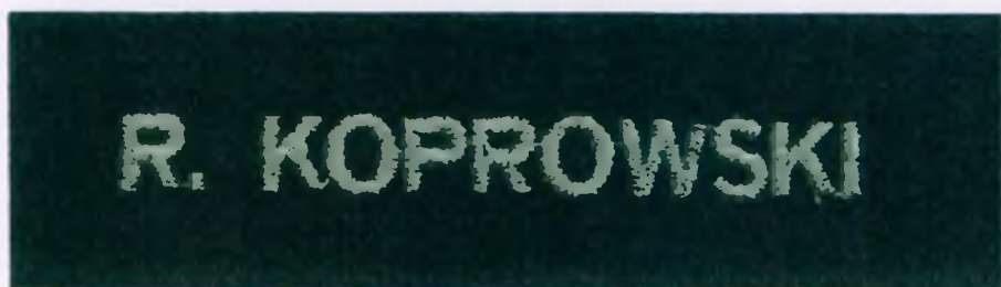
Wzór znaku identyfikacji imiennej noszonej na kurtce służbowej letniej, kurtce służbowej zimowej z podpinką i ocieplaczem z polaru, swetrze oraz ocieplaczu z polaru (jeśli występuje jako samodzielny element ubioru służbowego)