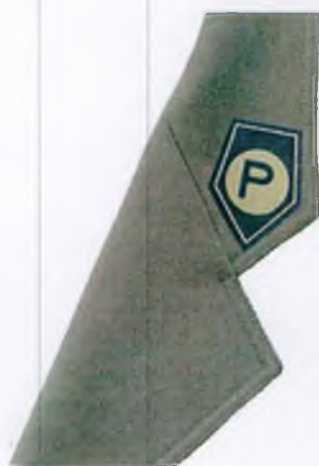
Sposób umieszczenia znaku rodzaju służby na kołnierzu kurtki wyjściowej