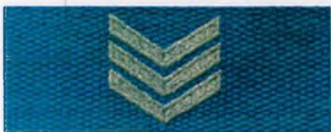
sierżant sztabowy Policji