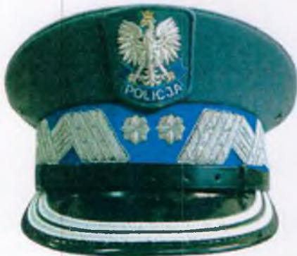
generalny inspektor Policji