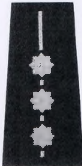
starszy aspirant Policji