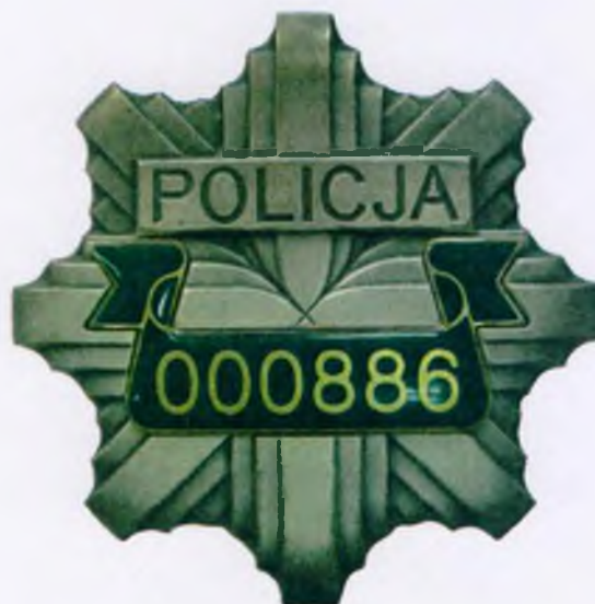
Wzór znaku identyfikacji indywidualnej policjanta