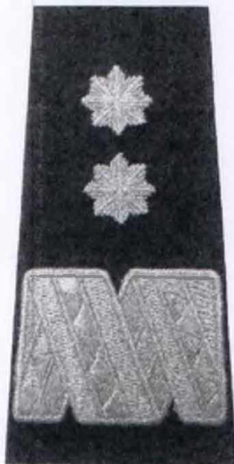
generalny inspektor Policji