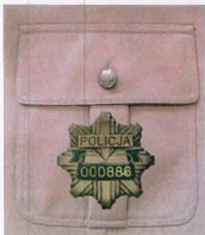
Sposób umieszczenia znaku identyfikacji indywidualnej