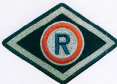
Służba prewencyjna, (komórki organizacyjne ruchu drogowego)