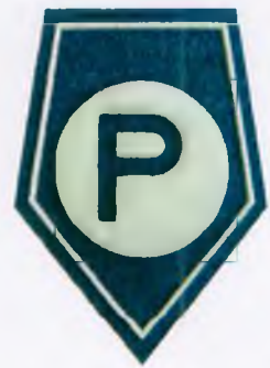
Służba prewencyjna (z wyłączeniem komórek organizacyjnych ruchu drogowego)