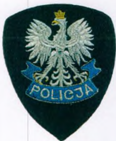
Do czapki ćwiczebnej i beretu