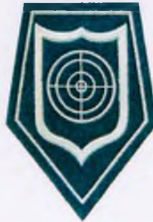
Oddziały prewencji i pododdziały antyterrorystyczne