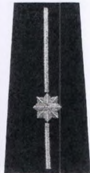
młodszy aspirant Policji