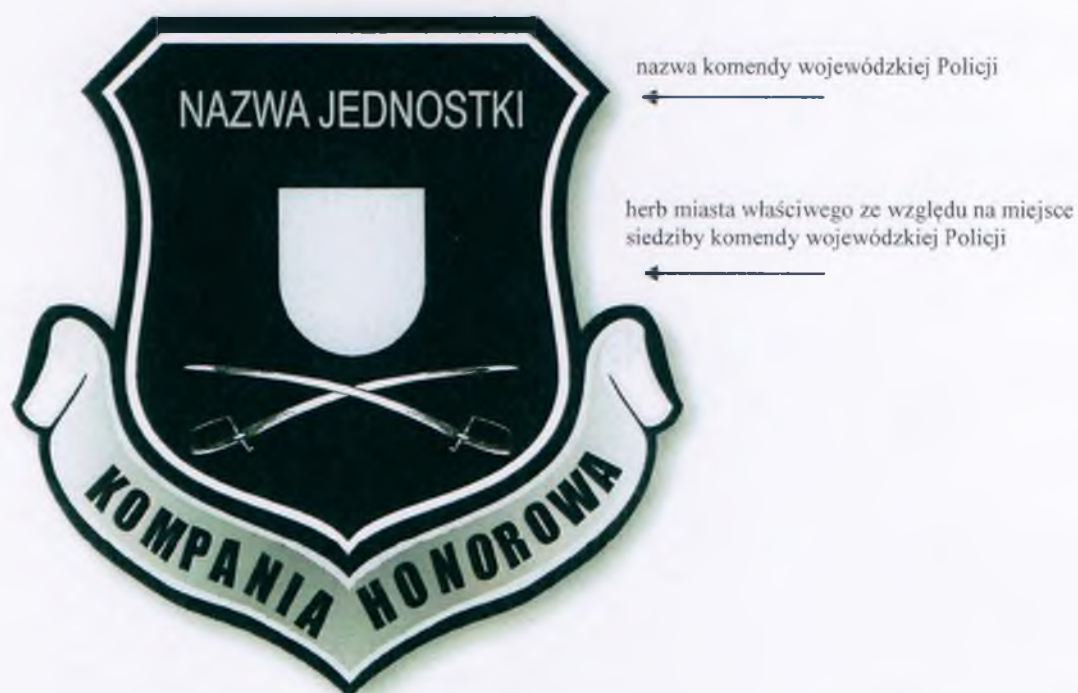
Emblemat kompanii reprezentacyjnej Policji