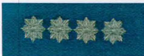
aspirant sztabowy Policji