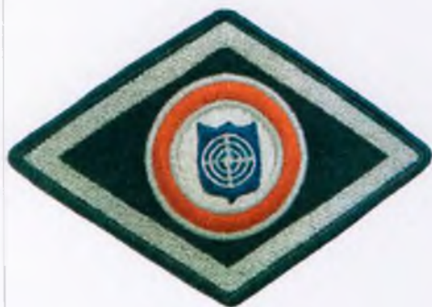
Oddział prewencji i pododdziały antyterrorystyczne