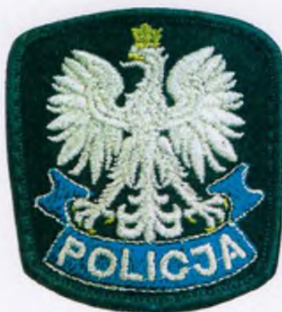
Do czapki letniej i zimowej