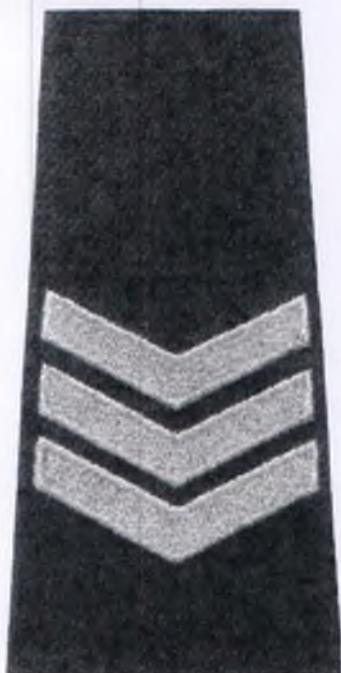
sierżant sztabowy Policji