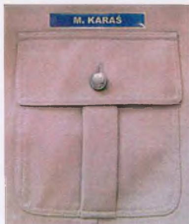
Sposób umieszczenia znaku identyfikacji imiennej