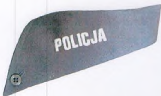
Sposób umieszczenia napisu „POLICJA” na kołnierzyku koszuli służbowej i koszuli służbowej letniej