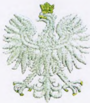
Znak generalnego inspektora Policji i nadinspektora Policji