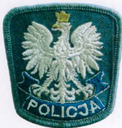
Do czapki gabardynowej