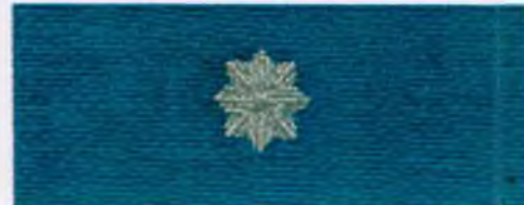
młodszy aspirant Policji