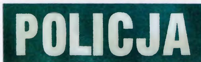
Wzór znaków do elementów ubioru służbowego