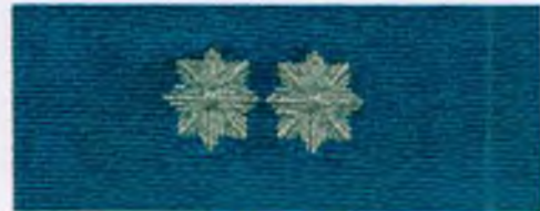
młodszy inspektor Policji