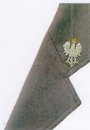
Sposób umieszczenia znaku generalnego inspektora i nadinspektora Policji na kołnierzu kurtki wyjściowej