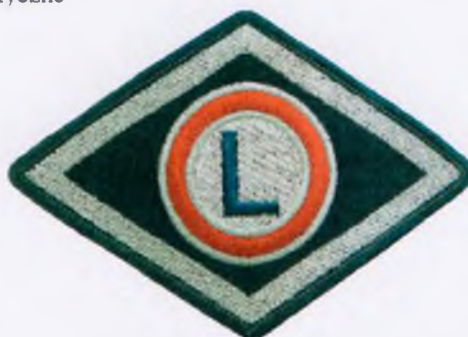
Służba wspomagająca, Wyższa Szkoła Policji w Szczytnie, Szkoły policyjne i ośrodki szkolenia Policji