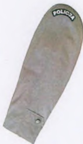
Sposób umieszczenia napisu „POLICJA” na rękawie płaszcza wyjściowego całorocznego