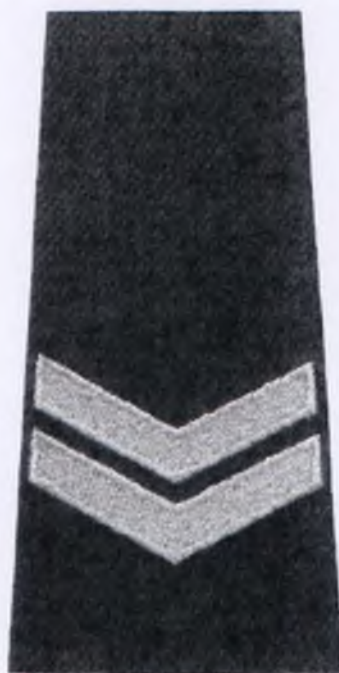
starszy sierżant Policji