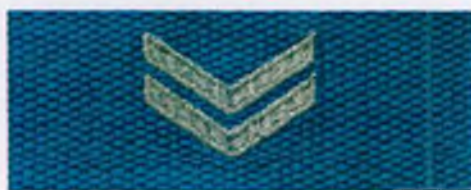
starszy sierżant Policji