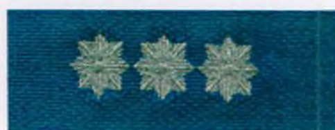
starszy aspirant Policji