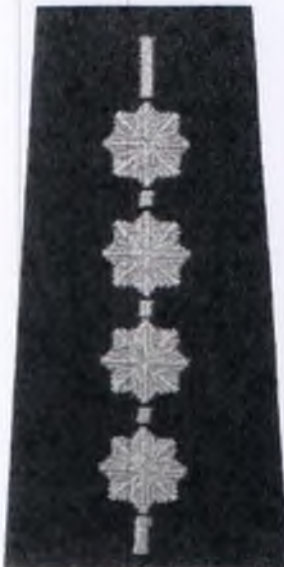
aspirant sztabowy Policji