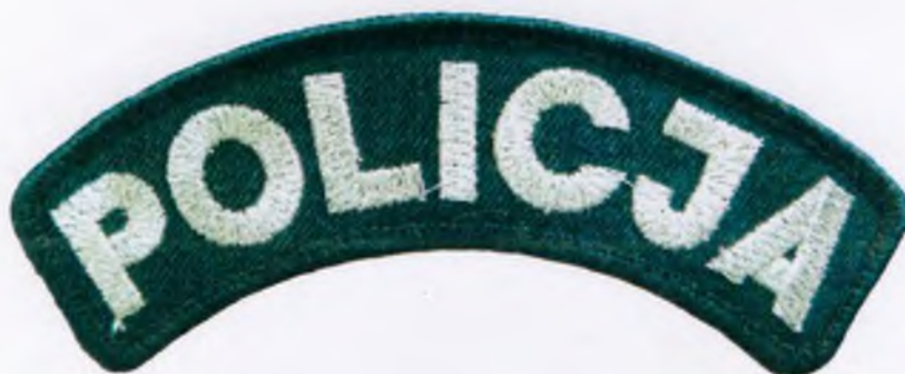
Wzór znaku do płaszcza wyjściowego całorocznego i kurtki galowej